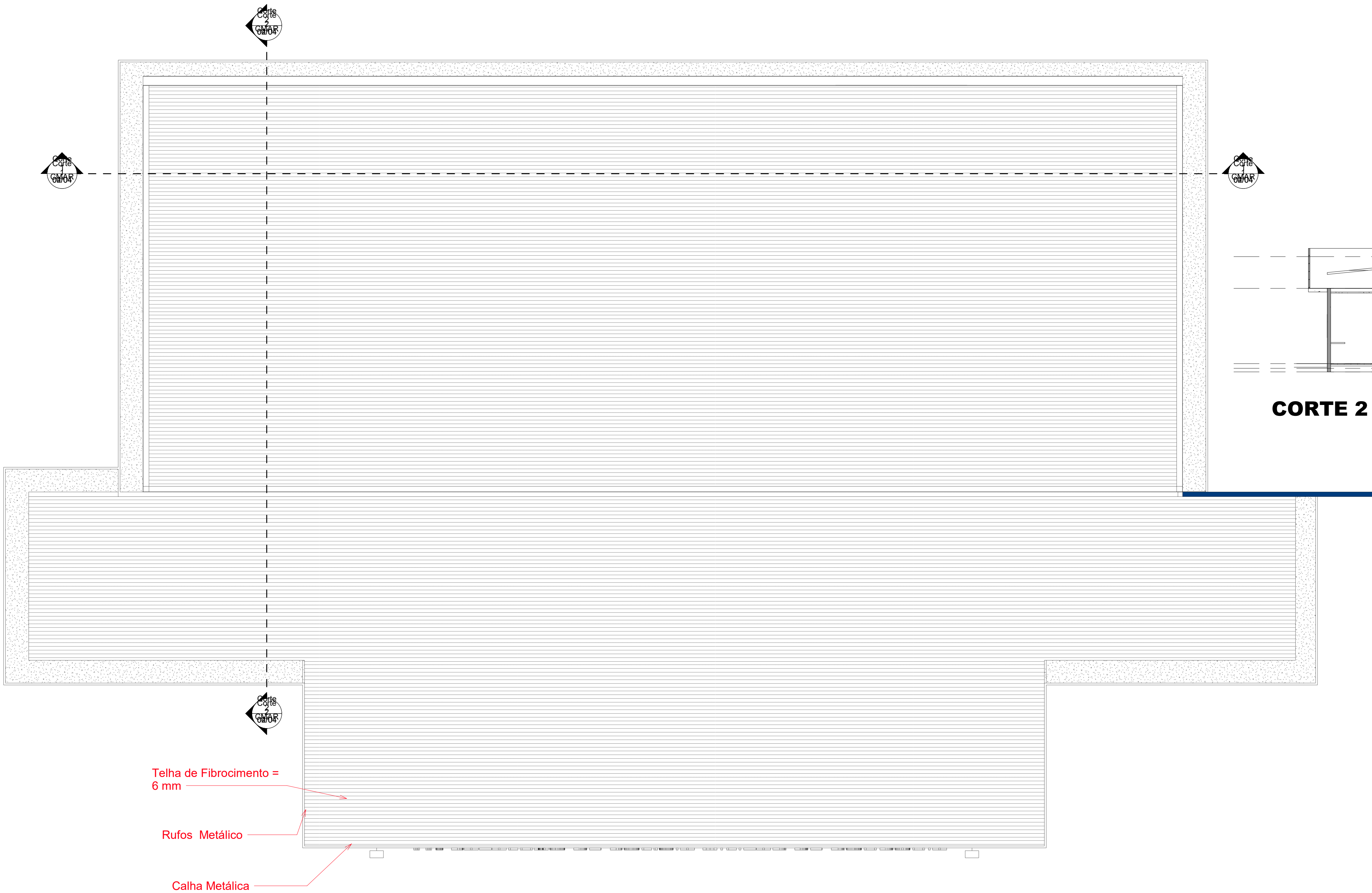
Planta de Cobertura - Esc: 1/100